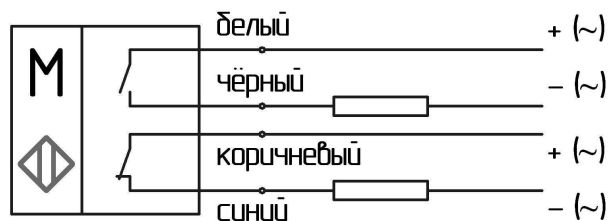
Схема подключения нагрузки