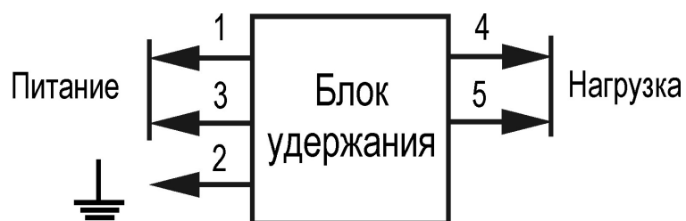
Рисунок 1. Схема подключения Блока Удержания.